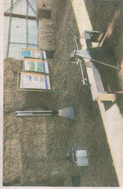
Le pulvé dynamique : démontrer les phénomènes de dérive.