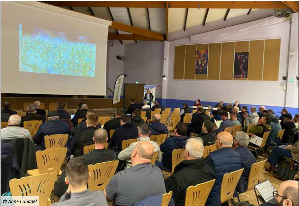
Réunie en assemblée générale le 12 décembre à Cosne-d'Allier, la coopérative agricole SICA BB a dressé le bilan d'un exercice 2024-2025 particulièrement éprouvant.